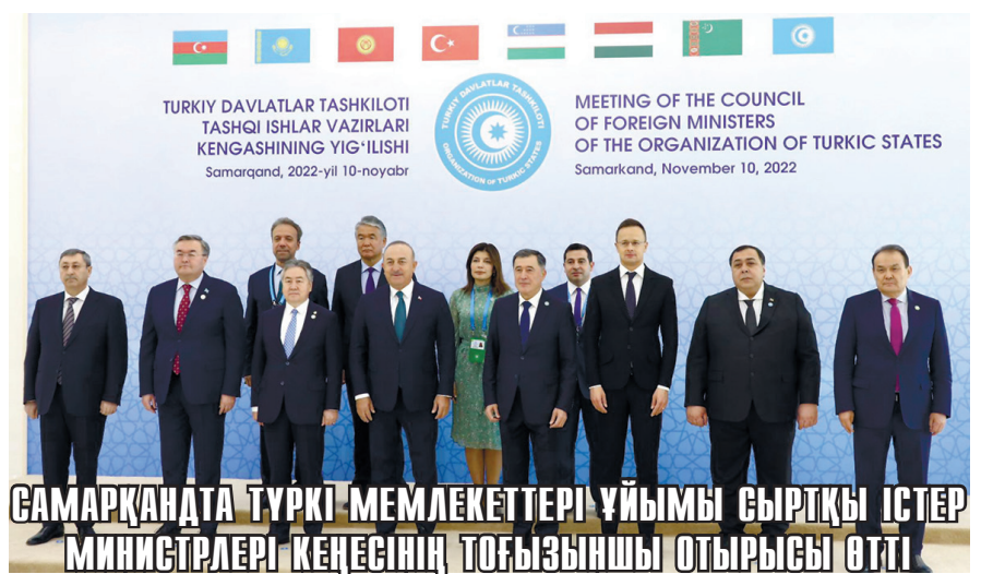
САМАРҚАНДА ТҮРКІ МЕМЛЕКЕТТЕРІ ҰЙЫМЫ СЫРТҚЫ ІСТЕР МИНИСТРЛЕРІ КЕҢЕСІНІҢ ТОҒЫЗЫНШЫ ОТЫРЫСЫ ӨТТІ

Әзірбайжан, түрік, ағылшын, орыс, парсы тілдерін еркін меңгерген.