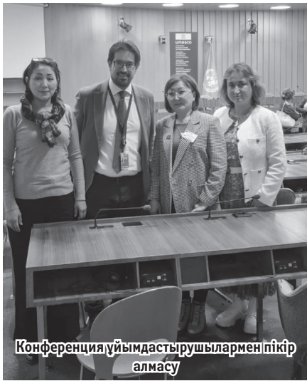
Конференция ұйымдастырушылармен пікір алмасу